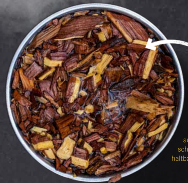
HICKORY HOLZ Hickory-Holz gehört zur Familie der Walnussgewächse und eignet sich besonders gut für das Räuchern von Fleisch. Vor allem in den USA setzt man schon lange bei Barbecues auf das besonders rauchige, fast schon scharfe Aroma des sehr belastbaren und haltbaren Holzes.

Seit Jahrhunderten wird das Räuchern eingesetzt, um Lebensmittel zu konservieren und zu aromatisieren. Da es früher keine Kühlschränke gab, musste man Lebensmittel anders haltbar machen. So wurden Fisch und Fleisch gesalzen bzw. gepökelt und dann für längere Zeit über dem Rauch von Holzfeuer aufgehängt. Dabei sank der Wassergehalt, was die Haltbarkeit verlängerte, und die äußere Haut wurde fester, was das Eindringen von Mikroorganismen und Insekten verhinderte. Zugleich wirkte sich der Rauch positiv auf das Aroma aus.