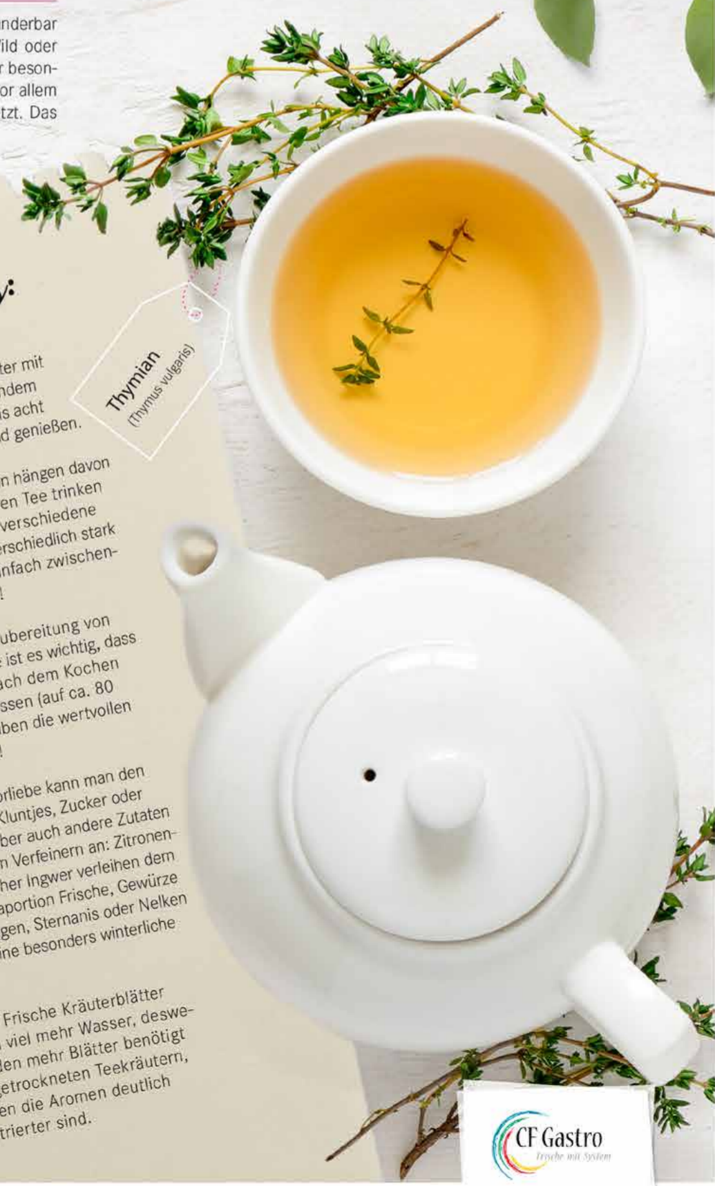
Thymian (Thymus vulgaris)

Hinweis: Frische Kräuterblätter enthalten viel mehr Wasser, deswegen werden mehr Blätter benötigt als bei getrockneten Teekräutern, bei denen die Aromen deutlich konzentrierter sind.