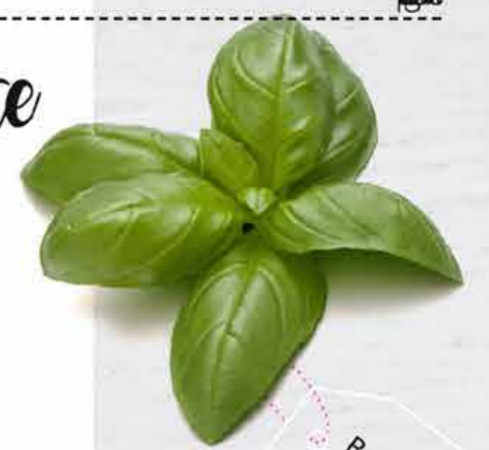
Basilikum (Ocimum basilicum)