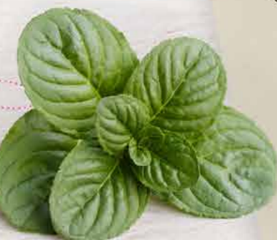
Pfefferminze (Mentha piperita)