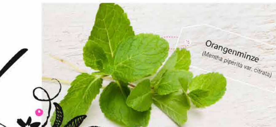
Orangenminze (Mentha piperita var. citrata)