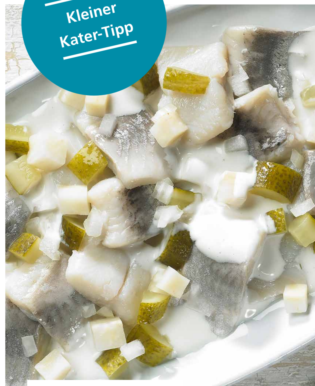
Matjessalat 1,0 kg Artikelnummer 24.235.050