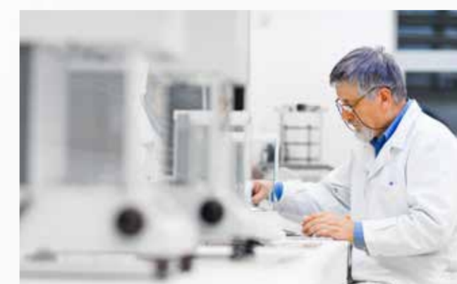
Durch das Rückstandsmonitoring werden Daten über Rückstände gesammelt und ausgewertet, um schnell auf Überschreitungen reagieren zu können.

Als DFHV-Mitglied nimmt CF Gastro am bundesweiten Rückstandsmonitoring „freshpoint“ teil. Hier werden risikoorientiert Rückstandsproben genommen und von anerkannten Laboren untersucht; anschließend werden die Ergebnisse in eine Datenbank, die von Chainpoint