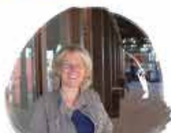
SPARGEL BUSCHMANN & WINKELMANN 14547 Beelitz