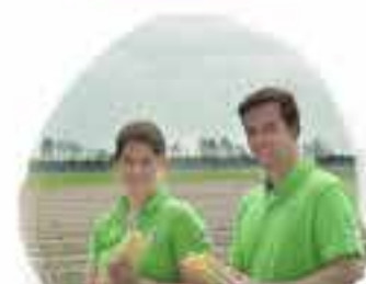
SPARGELHOF HÜCHTKER 48336 Sassenberg