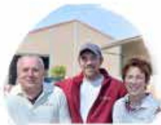
SPARGEL SIMMET 55234 Ober-Flkrsheim