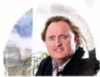
SPARGEL + BEEREN BAUMANN 94333 Geiselhöring