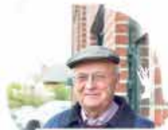
SPARGELHOF THIERMANN 27245 Kirchdorf