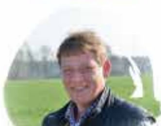
SPARGELHOF SOLTAU 22865 Barsbüttel