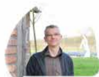
BECKMANN'S SPARGEL 46244 Bottrop