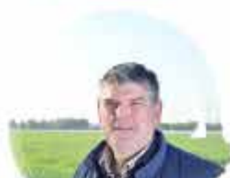
SPARGELHOF FREY 64291 Darmstadt