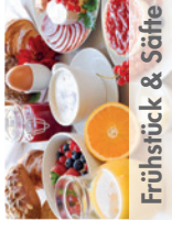
Frühstück & Säfte