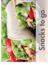
Snacks to go