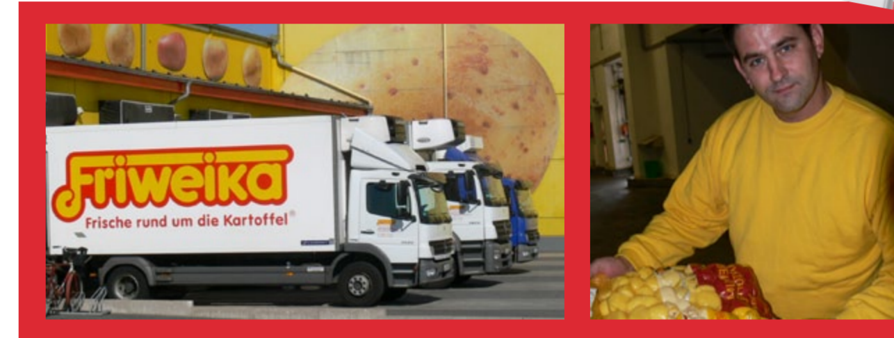
Die Lieferflotte des CF Gastro Verbundpartners Friweika – auf modernstem Stand

Die Genossenschaft FRIWEIKA (eine Namenskomposition aus FRIsche WEidendorfer KARtoffelprodukte) beschäftigt mehr als 300 Mitarbeiter und ist damit einer der größten und auch sozial nachhaltigsten Arbeitgeber in der Region. Allein im letzten Jahr verarbeitete das Unternehmen ca. 130.000 Tonnen Kartoffeln und Zwiebeln. Diese Rohwaren bilden die Basis des umfangreichen Sortiments für den Einzelhandel, Großverbraucher, Industrie und Gastronomie: frische Kartoffeln, Speisekartoffeln, Zwiebeln, verarbeitete Kartoffelprodukte, Fertiggerichte und Schälkartoffeln. Für all diese Produkte ist Qualität immer oberstes Gebot – vom Acker bis zum Gaumen. Ein ausgefeiltes Qualitätsmanagementsystem bei FRIWEIKA umfasst die Sorten- und Pflanzgutwahl, den Anbau und die Bestandsführung sowie die Ernte, Lagerung, Aufbereitung, Verarbeitung und Vermarktung der Kartoffeln bis hin zum Kunden. Im Bereich „Abpacken von Speisekartoffeln und Zwiebeln, Herstellung von Garkartoffel- und Kartoffelteigprodukten sowie Kartoffelsalat“ ist das Unternehmen nach IFS Food (Version 5) zertifiziert. Zudem besitzt FRIWEIKA bereits seit 2003 das „Grünstempel“-Zertifikat, welches sicherstellt, dass angebotene Bio-Produkte tatsächlich aus ökologischem Landbau stammen.