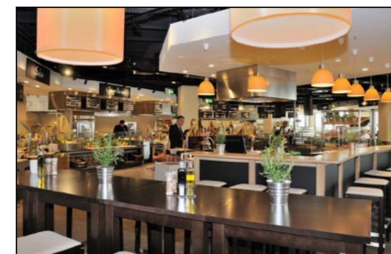
Das Leonhard's in der Galeria Kaufhof Frankfurt – ein Marktplatz der Genüsse auf 900 qm

Die DINEA Gastronomie GmbH ist einer der Vorreiter moderner und innovativer Warenhausgastronomie in Deutschland. Mit ihrem neuen Restaurant-Konzept „Leonhard's“ tritt das Unternehmen wiederum den Beweis dafür an. Unter dem Motto „Gutes.Frisch.Genießen“ werden seit 15. September in der 7. Etage der Galeria Kaufhof in Frankfurt Gäste auf 900 qm mit „à la minute“ gekochten Gerichten verwöhnt. Ein Großteil der Frische-Zutaten kommt dabei saisonal und regional von CF Gastro.