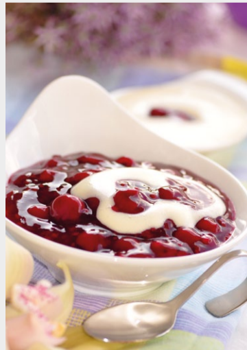
Frucht pur: Kirschrütze.

Unser Angebot bietet neben den Klassikern auch regelmäßig neue, abwechslungsreiche Kreationen. Die Desserts vom FRUCHTHOF werden in Verpackungseinheiten von 1 kg oder 1,5 kg geliefert - ideal für die Gastronomie.