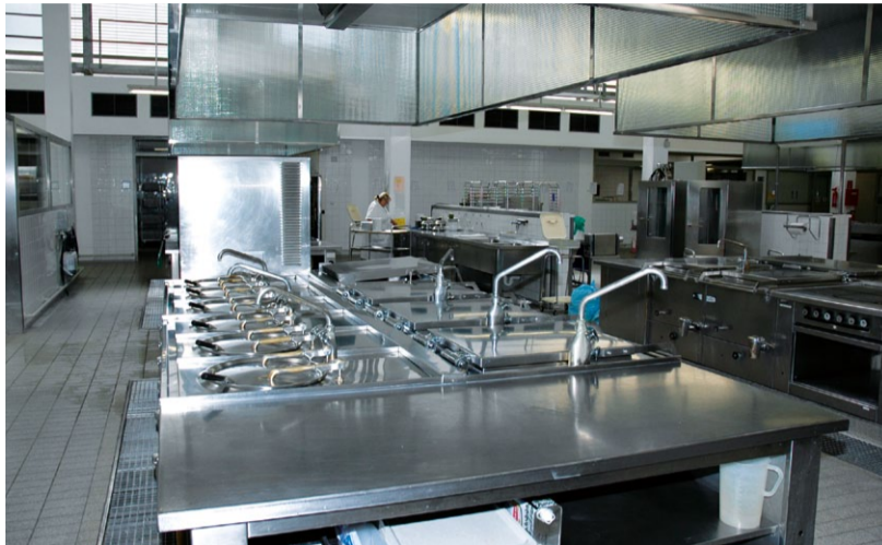
Blick in eine Krankenhaus-Großküche.

Im Schälkartoffel- und Gemüsebereich nähern sich die Preisunterschiede zwischen konventioneller und Bio-Ware an. Ob Obst und Gemüse, Molkereiartikel, Dressing, Antipasti,