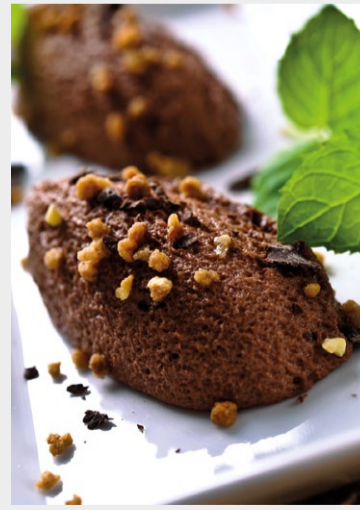
Verlockend: Mousse au chocolat.