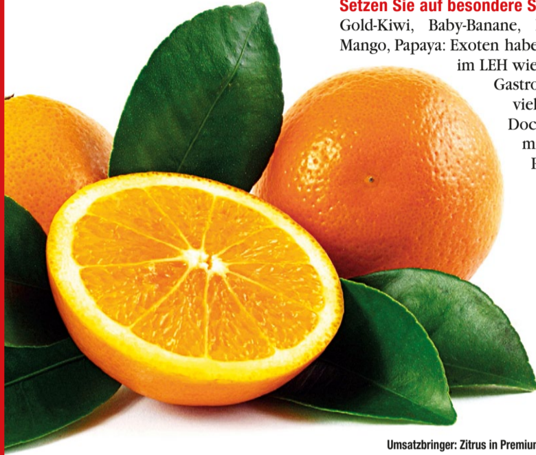
Umsatzbringer: Zitrus in Premium-Qualität.

Nutzen Sie die Chancen, die Obst und Gemüse auch in der kalten Jahreszeit bieten! Der FRUCHTHOF NORTHEIM hält für die Gastronomie und den LEH im Wintergeschäft interessante Möglichkeiten der Wertschöpfung bereit.