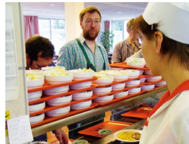
Essensausgabe in der Kantine.

Wir arbeiten mit eingespielten großen Erzeugern und Produzenten zusammen und haben z.T. exklusiv für uns reservierte Erntemengen. Zudem liefern wir zuverlässig im definierten Zeitfenster an.