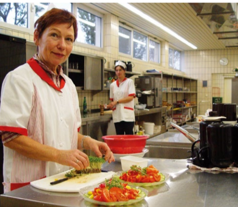
Frisches Obst und Gemüse sind ein Zeichen hochwertiger Gemeinschaftsverpflegung.