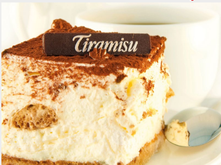
Typisch Italien: Tiramisu.

Ein italienisches Essen erfordert einen besonderen Nachtisch: Tiramisu aus Venetien oder die norditalienische Panna Cotta. Daneben führt der FRUCHTHOF aber auch Desserts wie beispielsweise Quarkcreme im